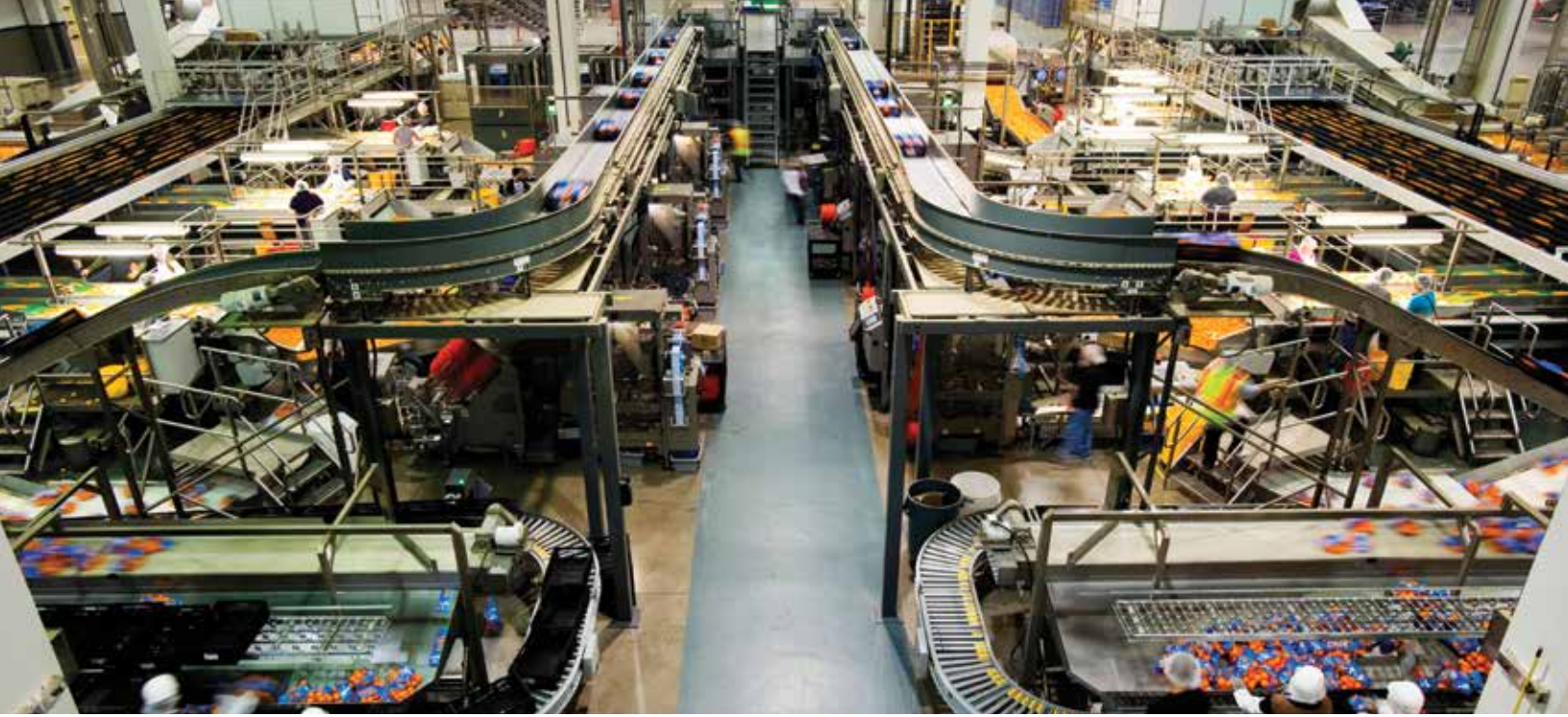
Les convoyeurs d'accumulation Accuglide MD dirigent les caisses vers les stations de palettisation Alvey 910.

afin d'évaluer le débit atteint, la fiabilité, le temps d'activité, la qualité de la palettisation et la sécurité. Les lignes de palettiseurs Alvey 910 personnalisés ont atteint ou surpassé tous les standards de performance et les prescriptions d'essais pour chacune des cinq unités.