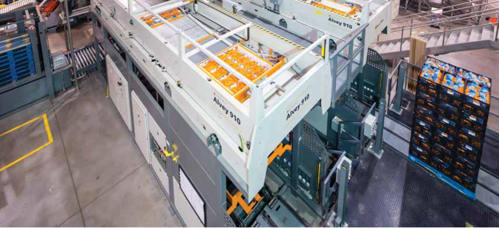
Les palettiseurs Alvey MD 910 empilent les caisses emboîtables selon le type d'emballage.